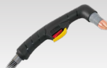
Ръчна горелка MT-70 70 А (50%) 6 m - 037502 12 m - 037519