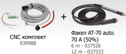
CNC комплект 039988