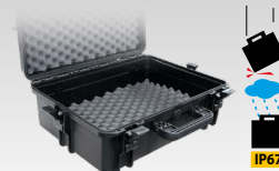
Калф за пренасяне 060432