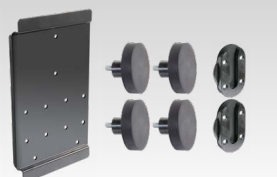
Поддръжка на MagnetFix 029637