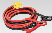
2 x 8 м - 16 mm 2 056572