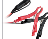
Svorky (45 cm)