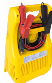
Opbevaring af kabler og klemmer i enheden.