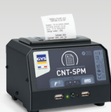
SPM : Smart Printer Module 026919