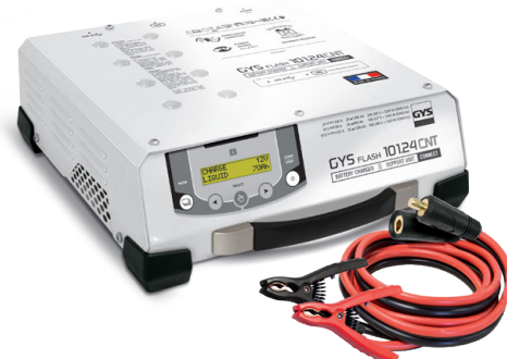
Ladekabel mitgeliefert (5 m - 25 mm 2 )