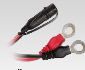
Öse-Stecker 45 cm - M6 029194