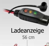
Ladeanzeige 56 cm