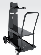
Fahrgewagen 10 m 3 ref. 041257