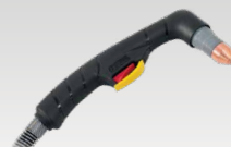
Antorcha MT-70 manual 70 A (50%) 6 m - 037502 12 m - 037519