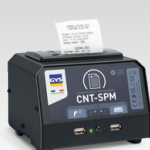
SPM : Smart Printer Module 026919