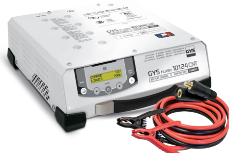
Incluye cables (5 m - 25 mm 2 )