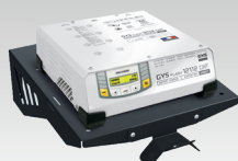
Tablet mural 055513