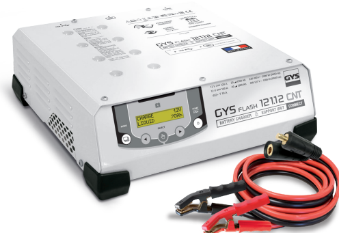
Incluye cables (5 m - 25 mm 2 )