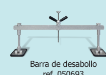
Barra de desabollo ref. 050693