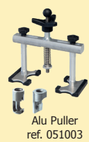
Alu Puller ref. 051003