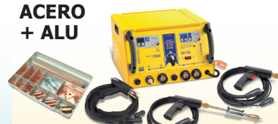
SPEEDLINER Combi 230 E PRO - ref. 036062