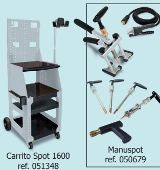
Carrito Spot 1600 ref. 051348