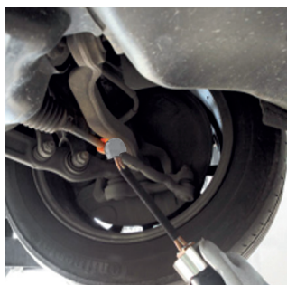
Desbloquear barras de acople.