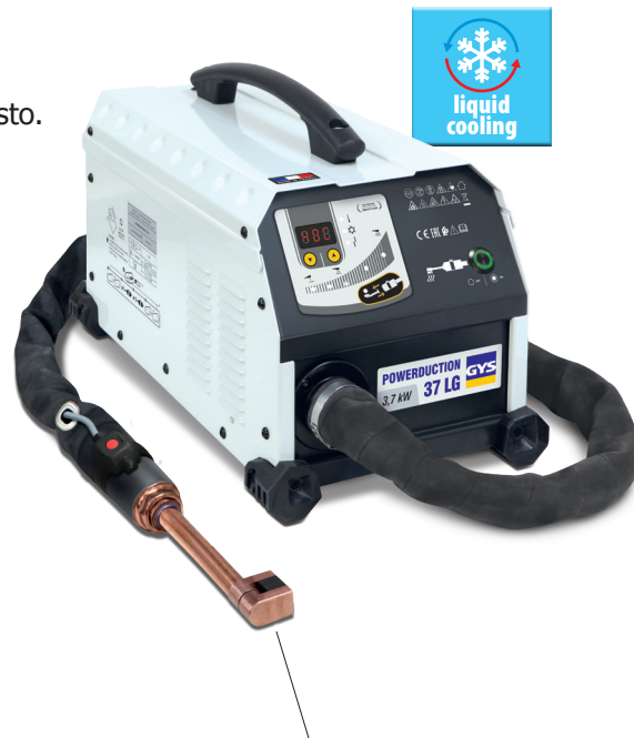
Generador entregado completo y ya montado, con 1 inductor de calentamiento de 90°.