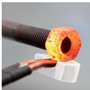
Desbloqueo de pernos