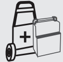
Carro 31 x 55 x 93 cm 45,5 kg