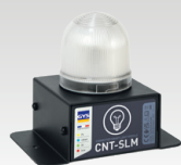
SLM : nutikas valgusmoodul 027978