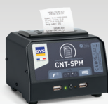
SPM : Nutiprinteri moodul 026919