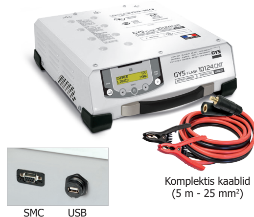
Komplektis kaablid (5 m - 25 mm 2 )