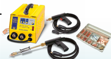
SPEEDLINER PRO 230 - ref. 036017 SPEEDLINER PRO 400 - ref. 036024