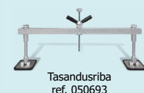
Tasandusriba ref. 050693