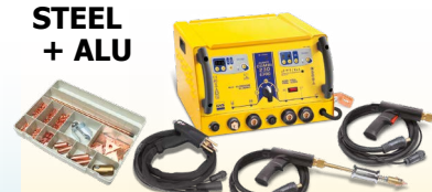
SPEEDLINER Combi 230 E PRO - ref. 036062