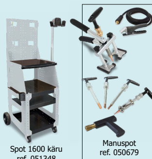
Spot 1600 káru ref. 051348