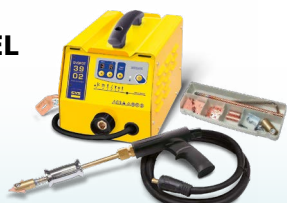
SPEEDLINER 39.02 - ref. 035010 SPEEDLINER 39.04 - ref. 035027