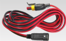
Jatkokaaapeli 2,5 m - 029057