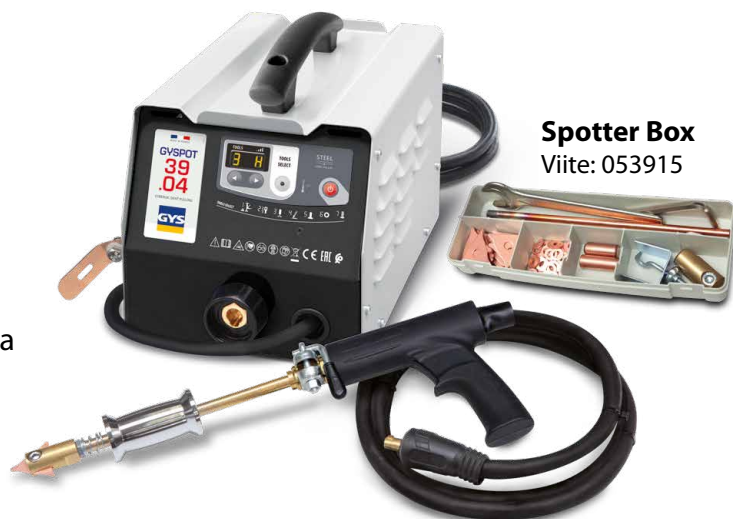
Spotter Box Viite: 053915

Hitsaus käynnistyy automaattisesti yksinkertaisella kosketuksella työkalun ja oikaisuosan välillä.