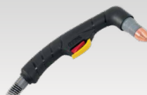
Torche MT-70 manuelle 70 A (50%) 6 m - 037502 12 m - 037519