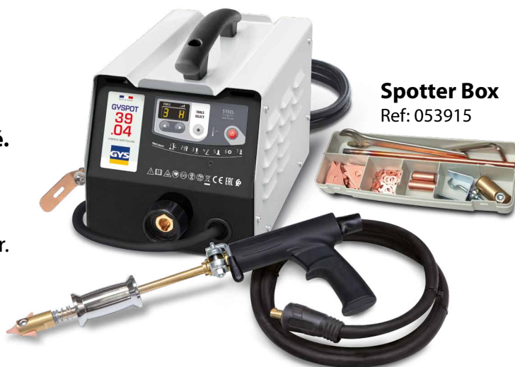
Spotter Box Ref: 053915

Le point de soudure est généré automatiquement par un simple contact entre l'outil et la pièce à redresser.