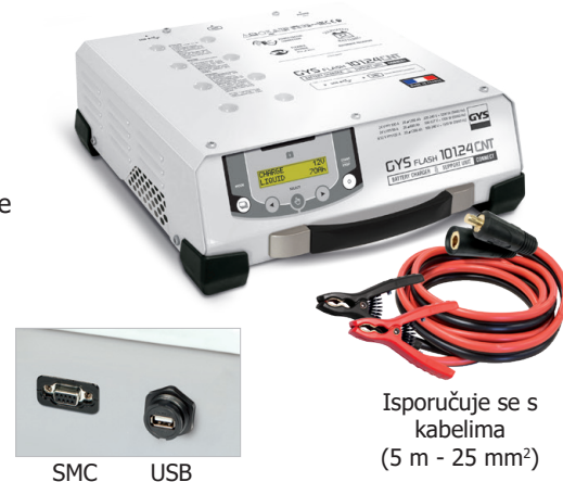
Isporučuje se s kablama (5 m - 25 mm 2 )