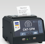
SPM: Modul pametnog pisaača 026919