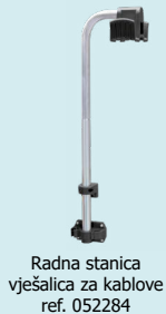
Radna stanica vješalica za kablove ref. 052284