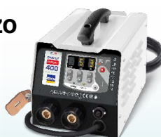
PROLINER PRO 230 - ref. 035799 PROLINER PRO 400 - ref. 035805