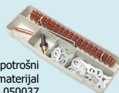
Čelična kutija za potrošni materijal ref. 050037