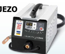
PROLINER 39.02 - ref. 035775 PROLINER 39.04 - ref. 035782