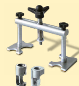
Alu tegljač ref. 051003