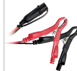
Pólushűtőcsipeszek (45 cm)