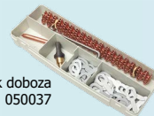
Acél fogyésközök doboza ref. 050037