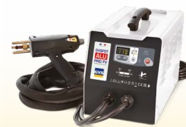
PROLINER ALU PRO FV - ref. 035836