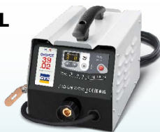
PROLINER 39.02 - ref. 035775 PROLINER 39.04 - ref. 035782