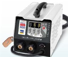
PROLINER PRO 230 - ref. 035799 PROLINER PRO 400 - ref. 035805