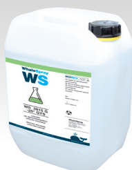
Hűtőfolyadék 10 L ref. 052246