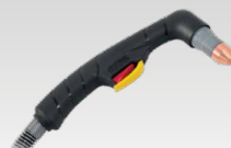
Torcia MT-70 manuale 70 A (50%) 6 m - 037502 12 m - 037519