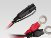
Connettore ad occhiello 45 cm - M6 029194