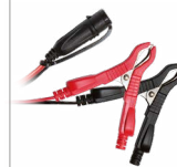
Morsetti (45 cm)