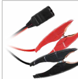
Morsetti (35 cm)