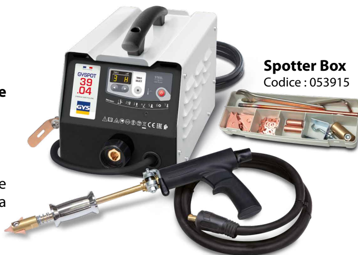
Spotter Box Codice : 053915

Il sistema di saldatura è generato automaticamente da un semplice contatto tra lo strumento e il pezzo da lavorare.