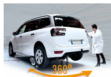
Ruota che permette di spostare il veicolo di 360°.