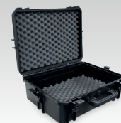
Valigetta da cantiere IP67 060432