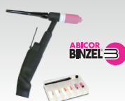
SR26L - 8 m 046184