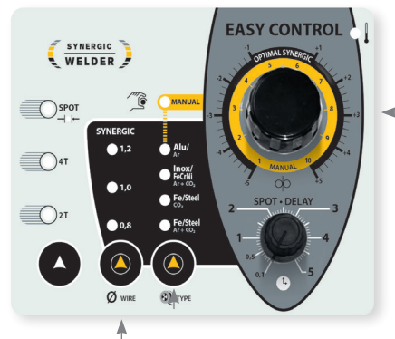
Modalità sinergica con regolazione diretta dei parametri di saldatura