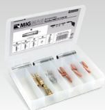
Scatola torcia MB36 (350 A) 041417