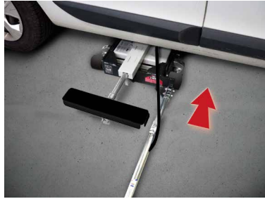
車両の下にらくらく挿入 (14センチまで下がります)

完全空気圧式車両リフト。車体の前部、または後部を楽に持ち上げられます(最大2.5トン)。車体整備や修理をより安全に、より快適にするお手伝いをします。スポットリフト・プロは、使用者がより快適な姿勢で作業できるようにすることで生産性を向上させます。