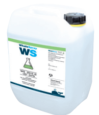
商品番号. 062511 クーラント特殊溶接 - 5 l