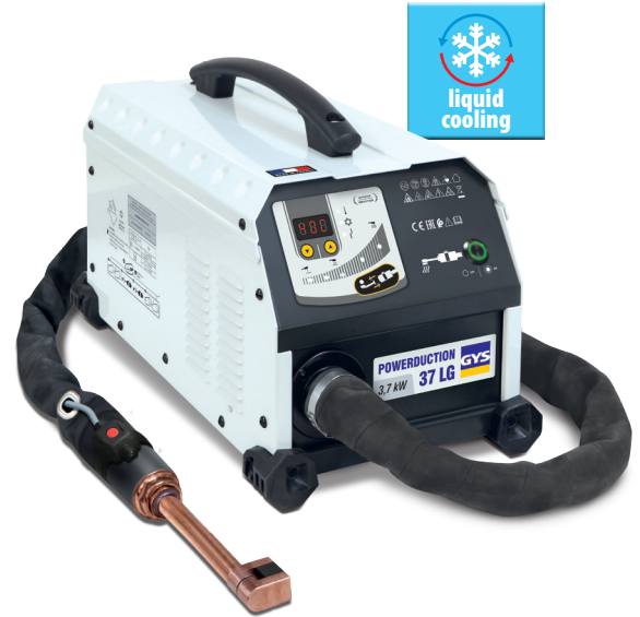
90°加熱用のインダクターが取り付けられた状態で梱包されています。