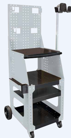
Vežimėlis SPOT 1600 nuoroda 051348