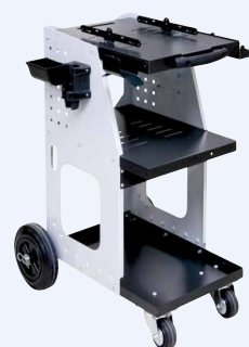
Vežimėlis UNIVERSAL 800 nuoroda 051331