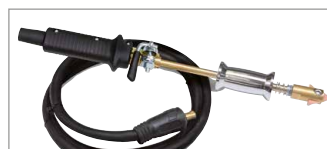
1 AUTOMATINĖ SABALO FORMOS RANKENA ref. 059207 - 3 m - Ø 70 mm 2

Kabelio ilgis: įžeminimas: 2 m maitinimo šaltinis: 8 m