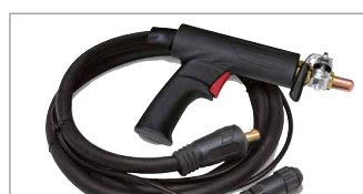
1 PISTOLETAS SU GAIDUKU ref. 057524 - 2 m - Ø 70 mm 2