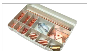
1 "SPOTTER BOX PRO" ref. 050075