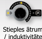
Stieples ātruma / induktivitātes regulēšana