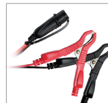
Klemmen (45 cm)