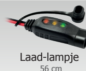
Laad-lampje 56 cm