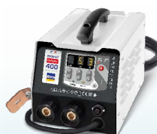
PROLINER PRO 230 - ref. 035799 PROLINER PRO 400 - ref. 035805