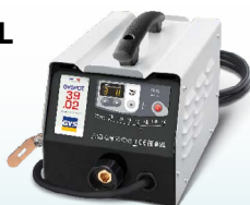
PROLINER 39.02 - ref. 035775 PROLINER 39.04 - ref. 035782