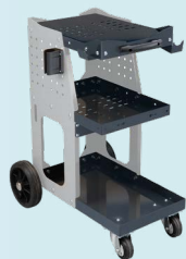
Spot 800 tralle ref. 051331