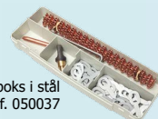
Forbruksmateriehboks i stål ref. 050037