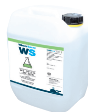
ref. 062511 kjølevæske spesialveising - 5 l