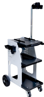
ref. 051331 + 052284 UNIVERSAL 800 + Arm med overheng