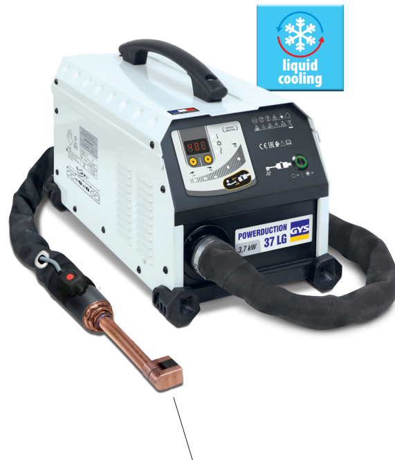
Leveres med en fullstendig induktor 90°