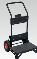
Carrinho diabo 039568