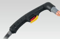
Tocha MT - 70 manual 70 A (50%) 6 m - 037502 12 m - 037519