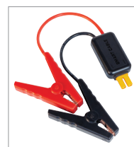
Cabo de arranque inteligente