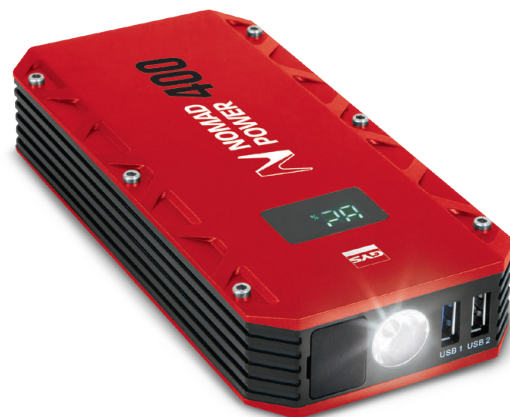
Ecrã a cores LCD

Muito leve (498 g) e compacto , cabe perfeitamente no porta-luvas do veículo, bem como numa mala de viagem.