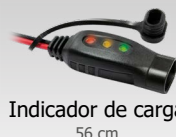
Indicador de carga 56 cm