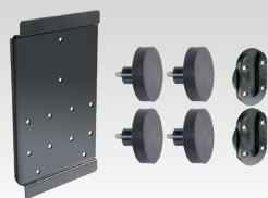
Suporte MagnetFix 029637