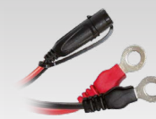
Conector terminal 45 cm - M6 029194