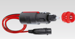
Kit pentru bricheta auto 35 cm - 029439