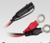
Conector terminal 45 cm - M6 029194