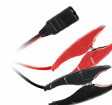
Cleme (35 cm)