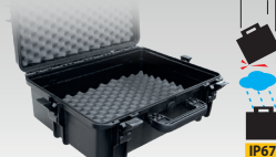
Кейс для транспортировки 060432