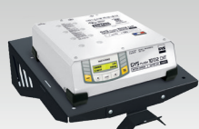
Полка с настенным креплением 055513