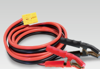
8 м - 16 мм 2 056572