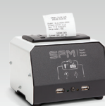
SPM : Блок принтера 026919