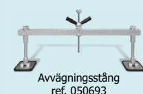
Avvägningsstång ref. 050693