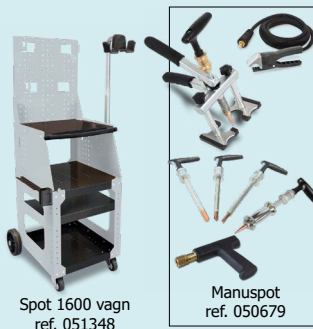
Spot 1600 vagn ref. 051348