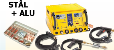
SPEEDLINER Combi 230 E PRO - ref. 036062