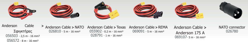
Anderson Cable > Σφικτήρες 056503 - 2,5 m - 16 mm 2 056572 - 8 m - 16 mm 2