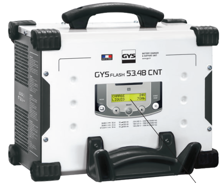
Διασθητικό περιβάλλον εργασίας διαθέσιμο σε 22 γλώσσες