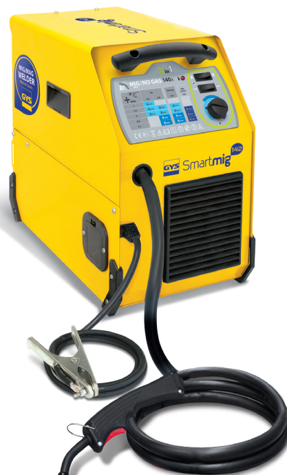
Entregado con cable de masa y antorcha fija 2m.

Su ventilador con caudal constante lo protege de los sobrecalentamientos.